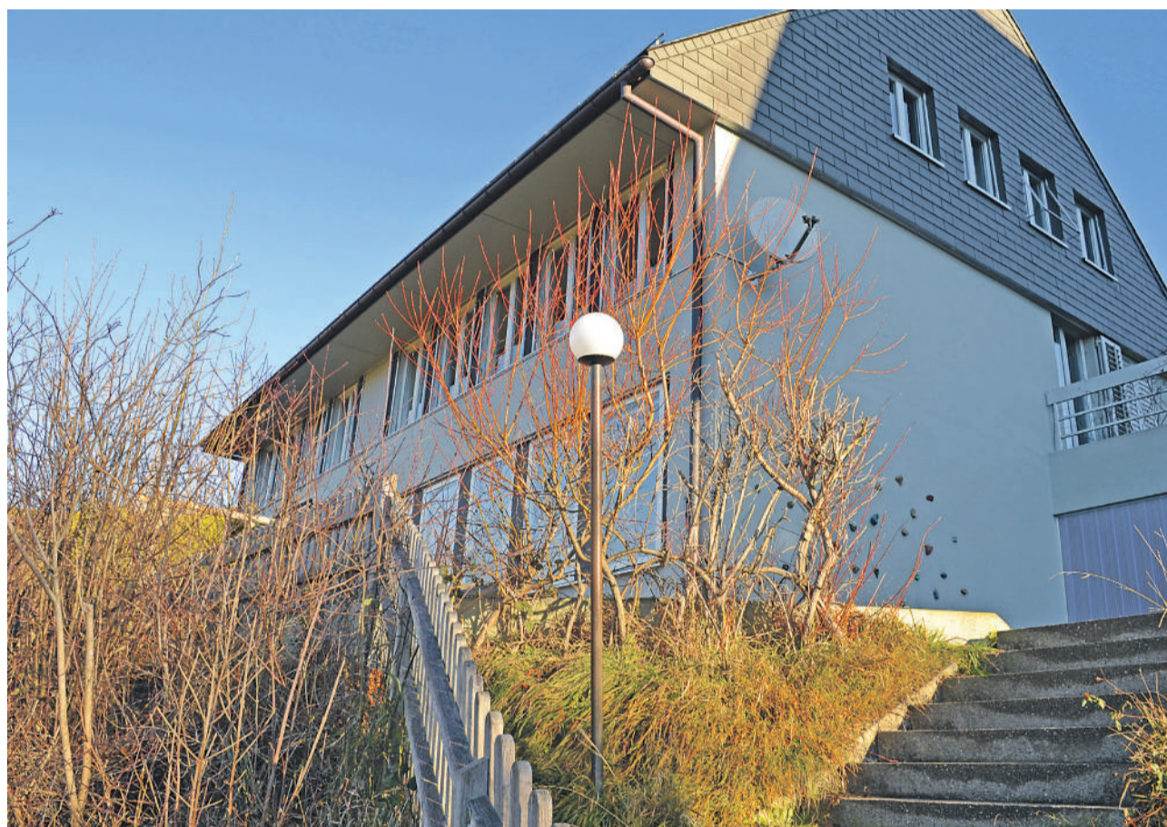
Das ehemalige Grundschulhaus für die Tagesschule

Weil auch im oberen Tösstal die Nachfrage nach Tagesbetreuung immer stärker wird und die Gemeinden verpflichtet sind, entsprechende Angebote zu schaffen, plant die Gemeinde Bauma für das Schuljahr