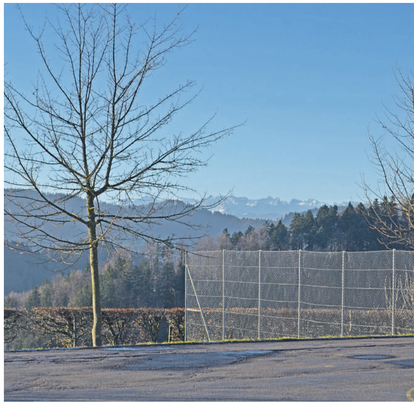
Schulhaus mit grossartiger Aussicht