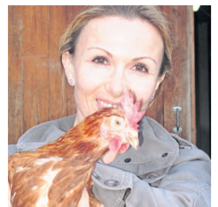
Die SUST vermittelt todgeweihte Hühner an neue Besitzer