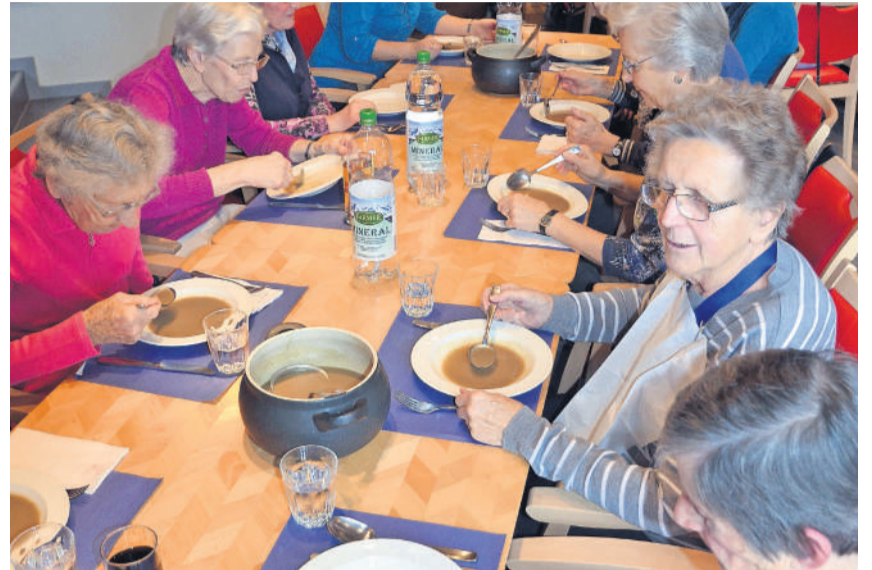
Gemeinsam essen macht mehr Spass

Rikon – Der Frauenverein Rikon organisiert seit Jahren jeden Monat ein Mittagessen für SeniorInnen, die gerne ab und zu mit KollegInnen zusammen essen und plaudern möchten. Schon vor 12 Uhr waren die Stühle an den langen Tischen besetzt mit einer aufgestellten Gesellschaft von Frauen. «Heute hat es auch Männer dabei», rief eine muntere Stimme. Sie wurde unterstützt von den anderen, die sich freuten, dass nicht nur Frauen, sondern eben auch das starke Geschlecht den Weg in den Spiegel gefunden hatte.