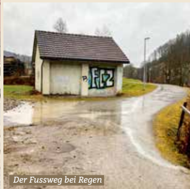
Der Fussweg bei Regen