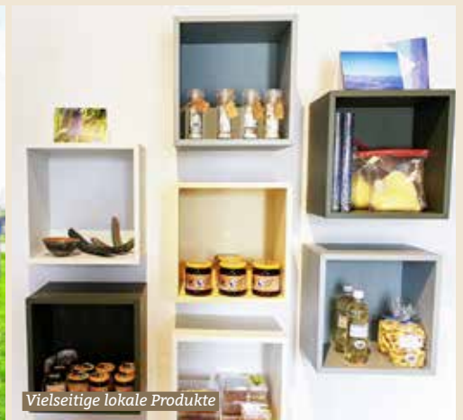
Vielseitige lokale Produkte