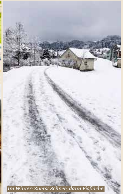
Im Winter: Zuerst Schnee, dann Eisfläche

Seit längerem kämpfen Bewohnerinnen und Bewohner des Quartiers Altlandenberg, Schulhausbenutzer und Hallenbadbesucher für ihr grosses Herzensanliegen von besseren, sicheren und sauberen Fusswegverbindungen ins Dorf. Der Fussweg zum Dorf ist die logische und meist frequentierte Wegverbindung des Quartiers Altlandenberg, mit ca. 700 Anwohnenden und wird unter anderem auch stark von den Kindern des Kindergartens, der Primarschule und Besucherinnen und Besuchern des Hallenbads genutzt.