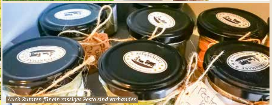
Auch Zutaten für ein rassiges Pesto sind vorhanden

Sternenberg ist ein beliebter Ort auch als Ausflugsziel. Seit knapp einem Jahr bietet der Sternemärt mit einem Selbstbedienungskonzept verschiedene lokale Spezialitäten an. Untergebracht ist der Märt im ehemaligen Waschhaus gleich gegenüber der Kirche. Der Laden ist 24 Stunden, an sieben Tagen geöffnet.