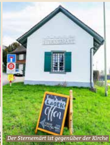
Der Sternemärt ist gegenüber der Kirche