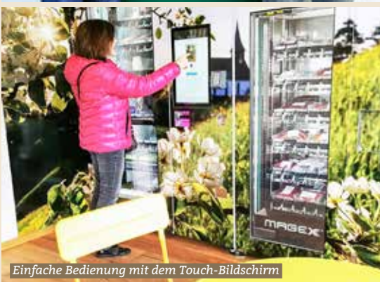
Einfache Bedienung mit dem Touch-Bildschirm