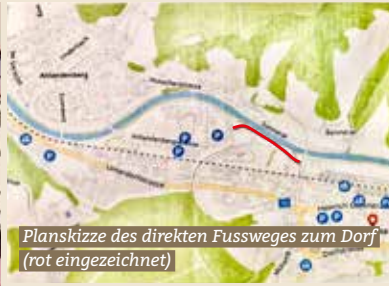
Planskizze des direkten Fussweges zum Dorf (rot eingezeichnet)